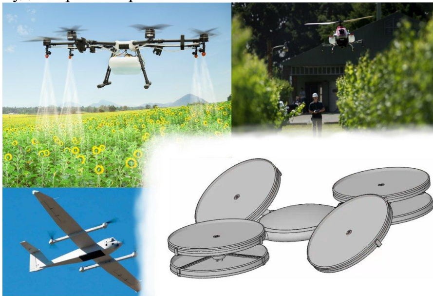
Рисунок 1 – Примеры конструкций беспилотных летательных аппаратов [1-3]

Речь идет о винтовых машинах (рис. 1), которые, без изменения своей конструкции, смогут осуществлять аналогичные функции в воздухе и под водой. Несмотря на то, что бесколлекторные винтовые электромоторы могут работать без влагозащиты, основную конструкцию с электроникой и приборами необходимо будет герметизировать.