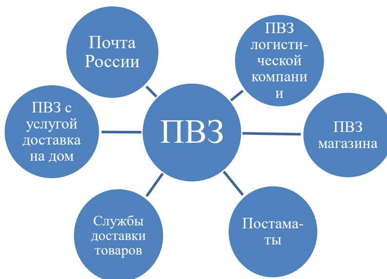
Рисунок 2 – Классификация пунктов выдачи заказов

Данный вид торговых объектов является наиболее безопасным, так как сокращается число контактов между людьми. На рисунке 2 представлена основная классификация пунктов выдачи заказов (ПВЗ).