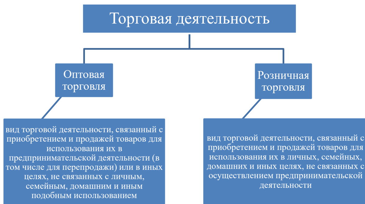
Рисунок 1 – Характеристика видов торговой деятельности

Постама́т – «автоматизированный терминал по выдаче товаров, созданный как услуга альтернативной доставки» [6].