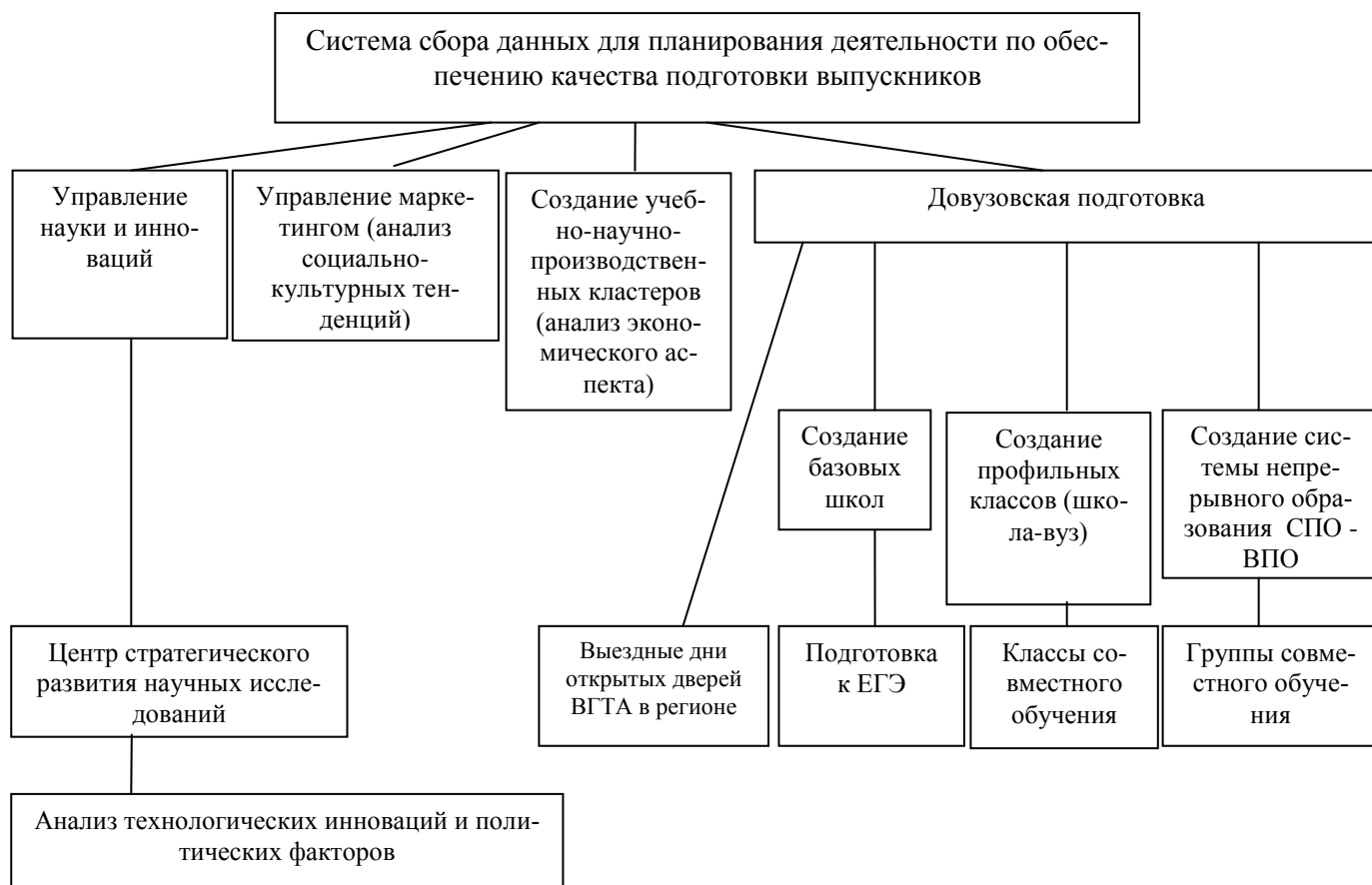
Рисунок 2.1 – Система сбора информации для обеспечения качества подготовки выпускников

В целях поддержания профессионального уровня персонала предприятий-партнеров кафедры институт регулярно участвует в мероприятиях университета по переподготовке и семинарах через ИПК, научное консультирование, выполнение совместных НИР. В рамках содействия распространению принципов всеобщего управления качеством (TQM) вне образовательного учреждения и организации совместной с другими организациями деятельности по улучшению качества подготовки выпускников.