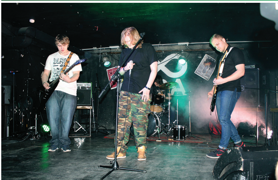
Рок-группа «Mad house»