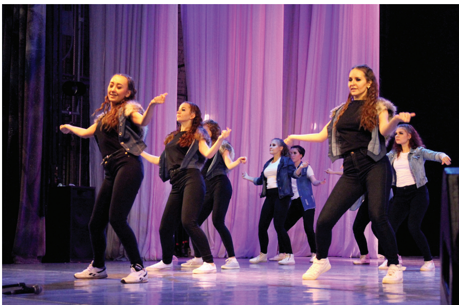
Танцевальный коллектив «Каприз»