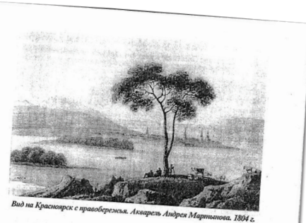
Вид на Красноярск с правобережья. Акварель Андрея Мартынова. 1804 г.

видно на улице. Уничтожаются и перегородки, привязанные к болтам стальной, чтобы можно было их отворить и затворять, не выходя с крыльца и портила стены для пропуска воздуха, но после уверения, что это — остаток старинной, защита при осаде, когда, не подвергаясь опасности, нельзя было выйти на улицу. К неудобствам города принадлежат беспрестанные, сильные ветры, дующие из окрестных гор... ...и, а в Красноярске ни собранья, ... ...приска идет об руку с образованностью перед столицами, он равняется ...и, помещиков в ней нет... ...ловина советников, по неимению ...арей губернских присутственных ...и в щель. Красноярск до сих пор ...бирь — университета... При по ...их к просвещению собственный