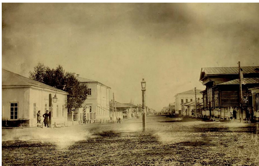
Перспектива Воскресенской улицы от Почтамтского переулка на северо-восток. Белые здания слева - почтовая станция и гостиница при ней, где останавливался Чехов. Напротив - здание Благородного собрания, сохранившееся до сих пор.