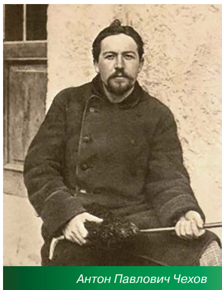
Антон Павлович Чехов