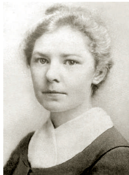
Этель Лилиан Войнич

Когда-то в Сибири говаривали, что не бежит только ленивый. Перед нами история такого «не ленивого» человека. 13 сен-