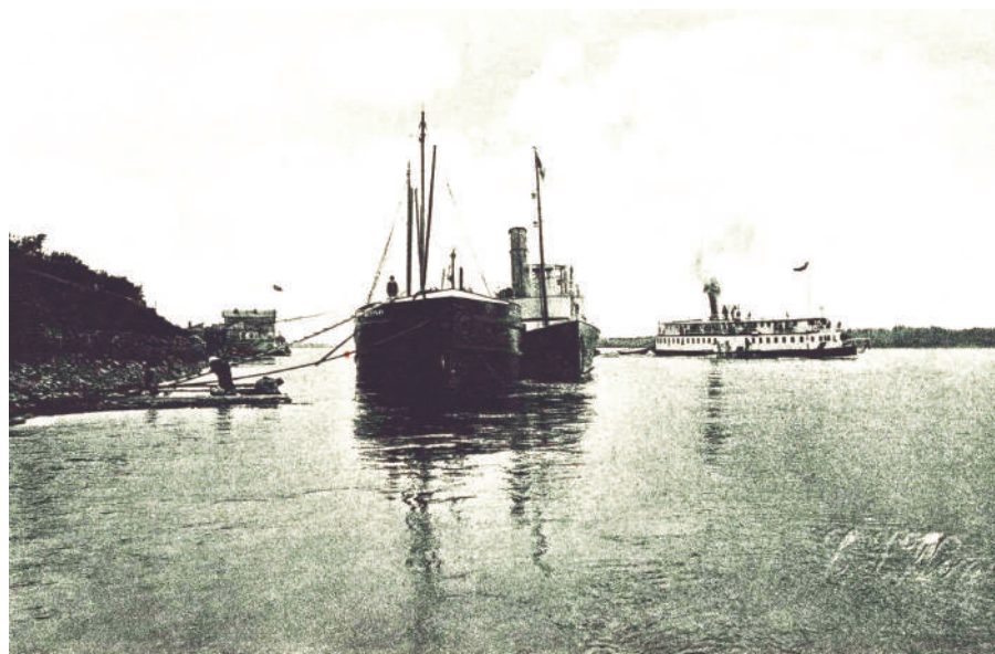
Берег реки у Енисея.

Известные три пристани: Черепанова для пароходов «Краснояр-рец» и «Минусинец»; Гадалова, где причаливали суда «Дедушка», «Москва», «Россия»; пристань Сибирякова, где швартуется «Св. Николай».