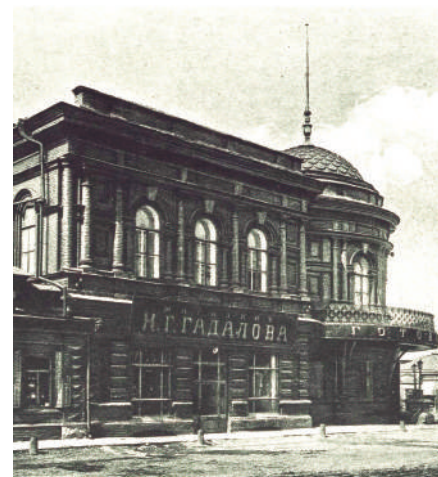
Торговый дом Гадалова.

К 1875 году появились ещё два парохода – «Николай» и «Александр», вдобавок водили семь барж. В Красноярске с 1872 года через Енисей пустили плашкоут со своеобразным названием