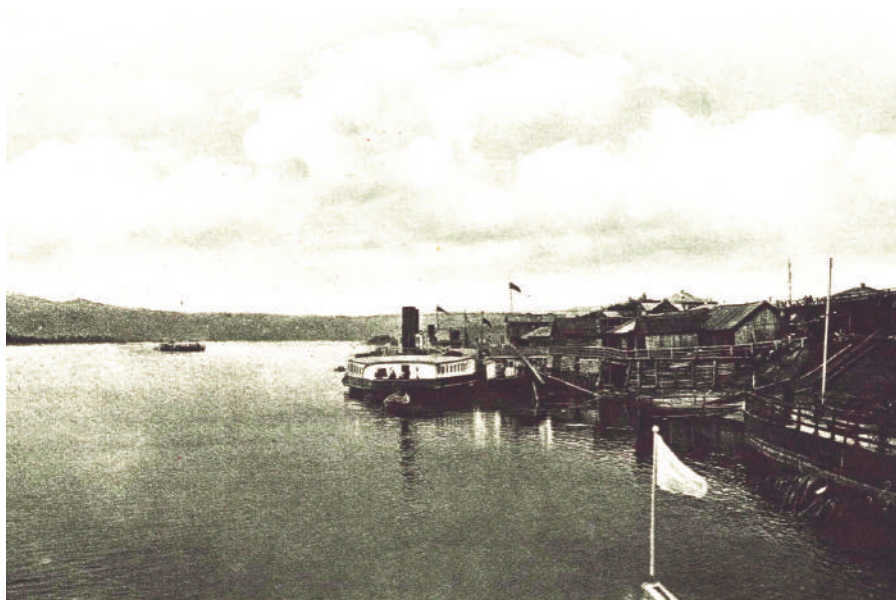
Пристань у Енисея.