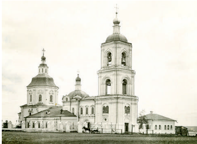
Воскресенский Собор, начало XX века