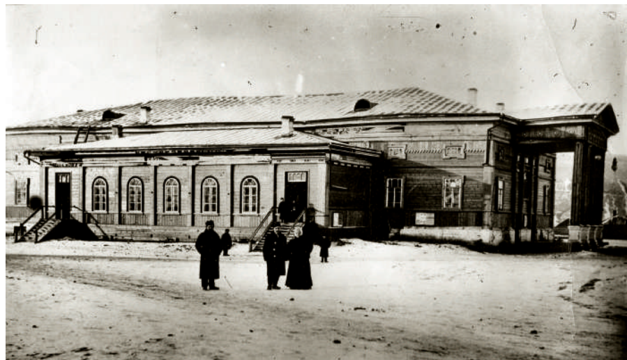
Первое театральное здание в Красноярске.