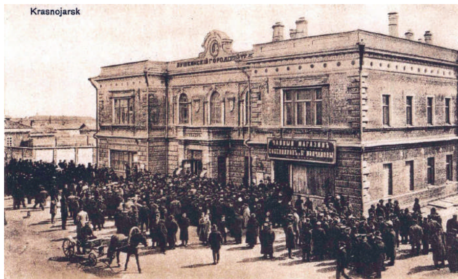
Пушкинский городской театр.