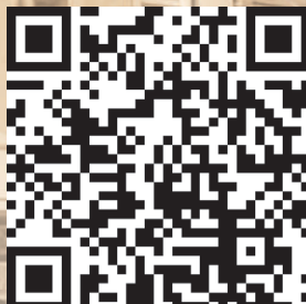
Пресс-центр Красноярского ГАУ