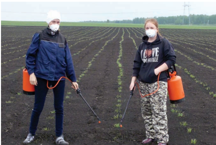
«ОПХ Соляное», Рыбинский район