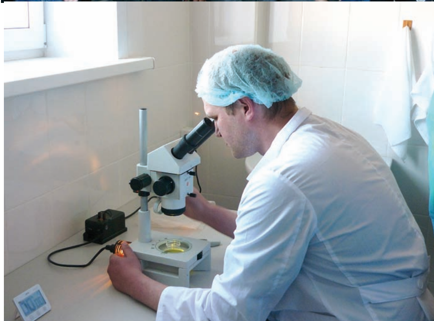
«Назаровское», Назаровский район