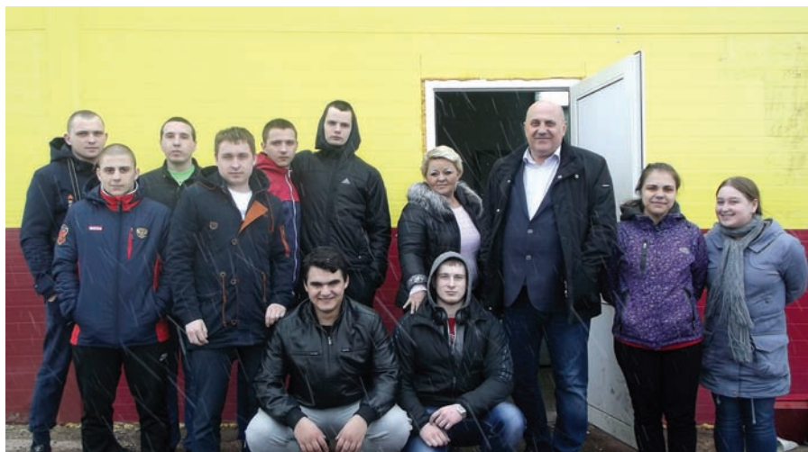
«Искра», Ужурский район

– Летнюю практику я прошла в «Тайнинском». Трудилась в должности зоотехника-селекционера. Выполняла такие виды работ, как взвешивание телят и телок случного возраста, биркование, составление актов на выбраковку животных из основного стада, проверка группы коров на мастит, оценка готовности зимних стойловых баз для