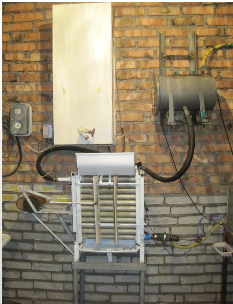
Установка для получения белка из зеленого сока (патент на полезную модель)