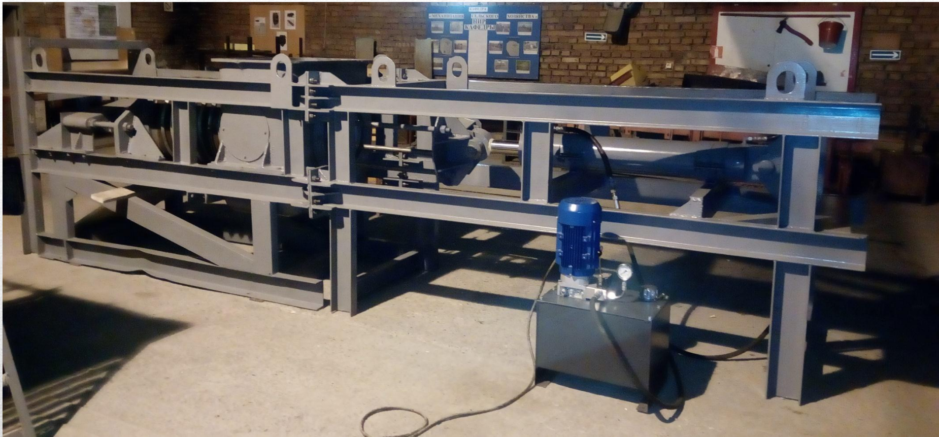
Пресс для механического обезвоживания зеленых растений