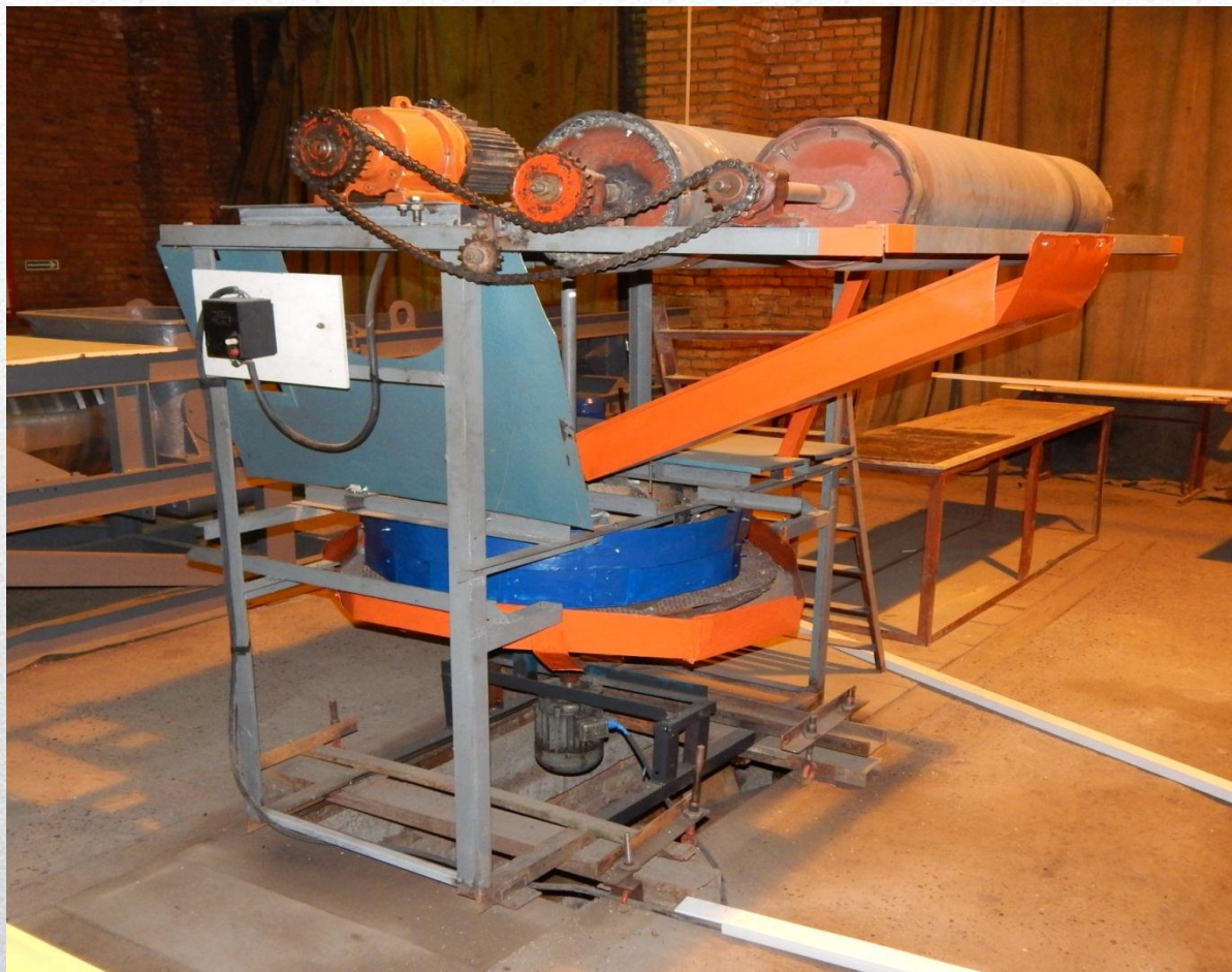
Устройство для сухой очистки корнеклубнеплодов (патент на полезную модель)