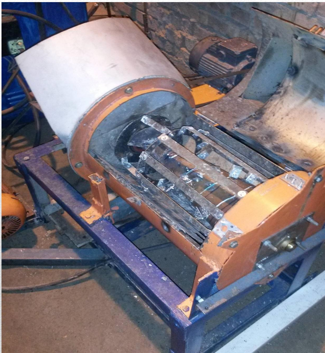
Измельчитель корнеклубнеплодов (патент на полезную модель)