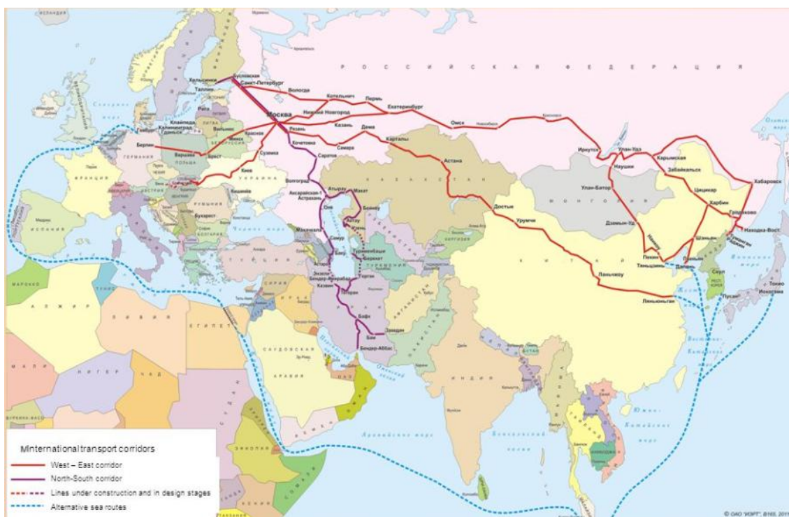
Рисунок 2 – Международные транспортные коридоры

Из разнообразия задач, которые должна выполнять таможенная логистика, необходимо выделить основные: