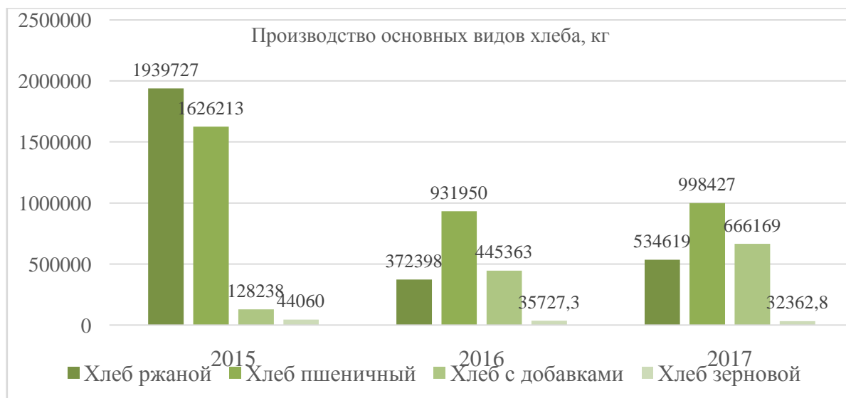
Рисунок 2 – Динамика производства хлеба на предприятии

Далее необходимо представить динамику производства хлеба – основного вида производимой продукции, в форме графика, пример представлен на рисунке 2.