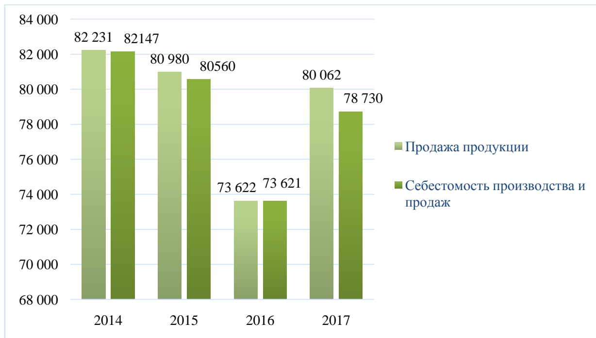
Рисунок 3 – Динамика продаж продукции, тыс. руб.

Далее необходимо приступить к формированию выводов. Анализ показателей, представленных в таблице 3 и на рисунке 3, позволяет сформулировать следующие выводы (формулируются выводы):