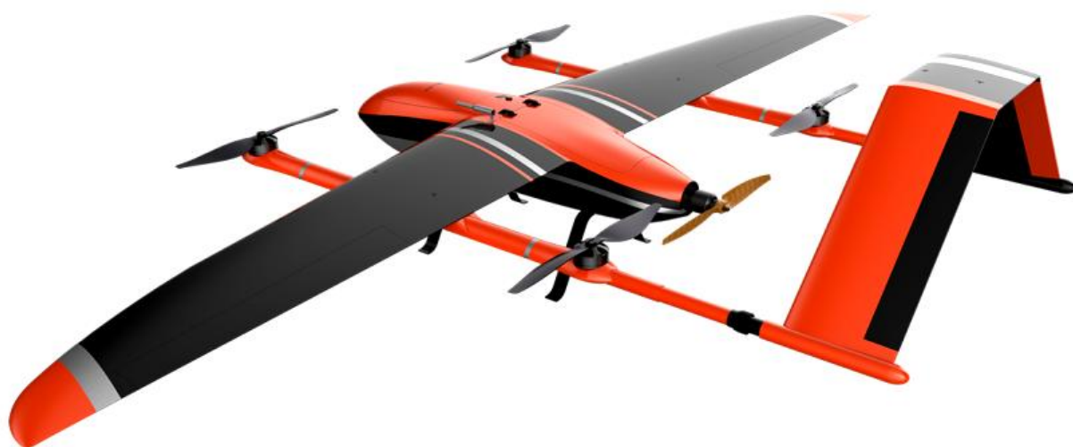
Рисунок 2 - БПЛА самолетного типа

В таком аппарате есть соответствующие системы, которые помогают оператору, просто кликая мышкой на экране, выбирать объект и вести его в автоматическом режиме.