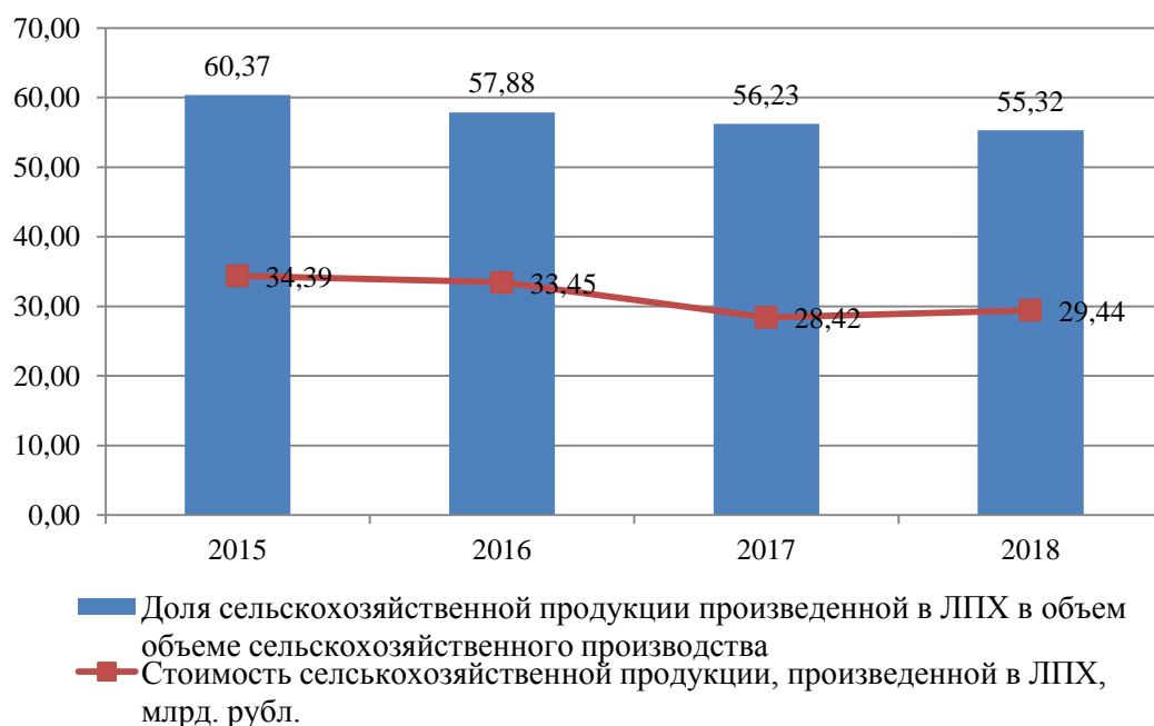
Рис. 2. Доля сельскохозяйственной продукции, произведенной в ЛПХ в общем объеме, %

Оценка частного индекса «уровень развития предпринимательской инициативы» приведена в таблице 7.