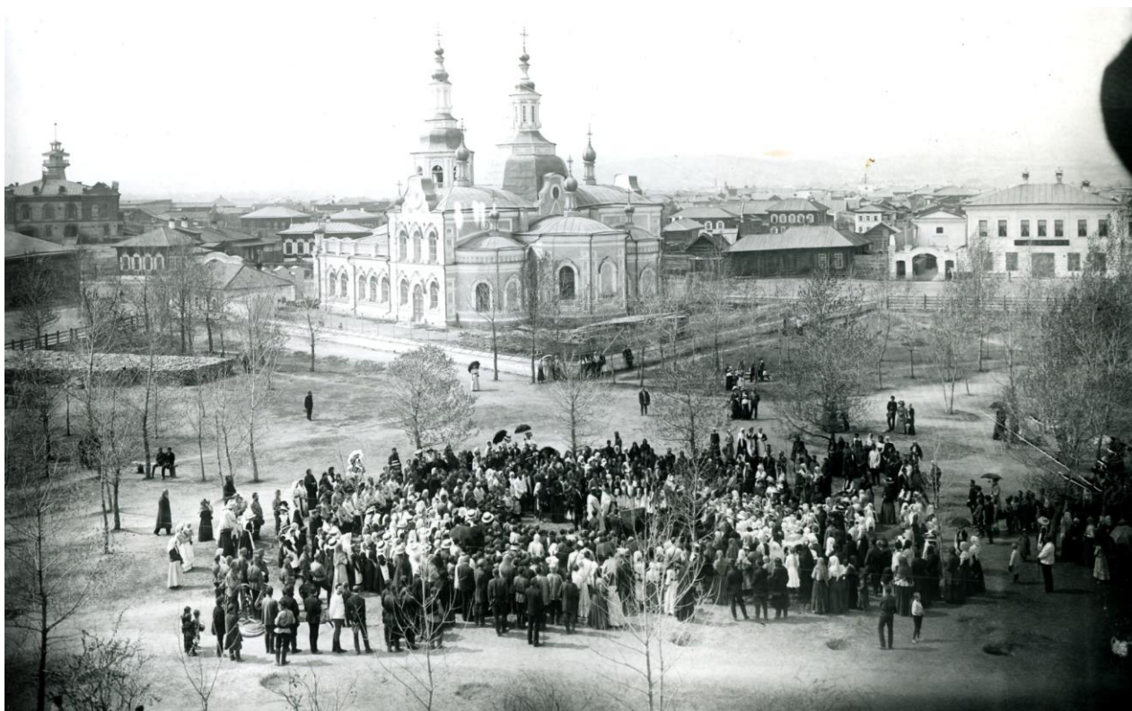
Рис. 1. Город Минусинск. Праздник древонасаждения. 8 мая 1911 г.

Жители заранее намечали совместно с городской управой, где заложить новый сад или сквер. В посадке принимали участие гимназисты, школьники вместе с родителями и учителями. При открытии скверов и садов проходил молебен. Праздник древонасаждения (как он назывался в те годы) сопровождался концертами и лотереей. На сохранившейся в музее старинной фотографии запечатлен один из моментов подобного мероприятия, состоявшегося в уездном городе Минусинске Енисейской губернии весной 1911 г. (рис. 1).