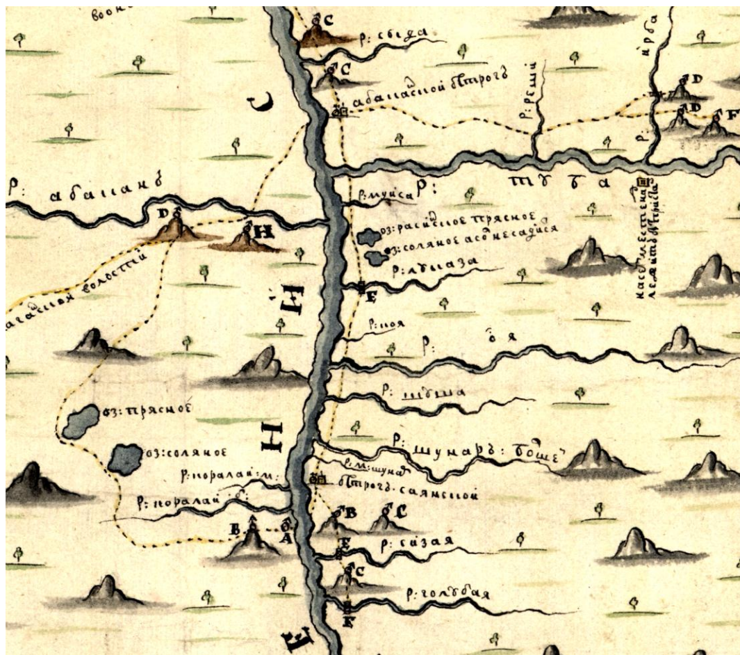
Рис. 3. «Примерной чертеж Томского Кузнецкого и Красноярского уездов по части, где описаны рудники и под заводы угодные места о том ниже сего литеры значат.