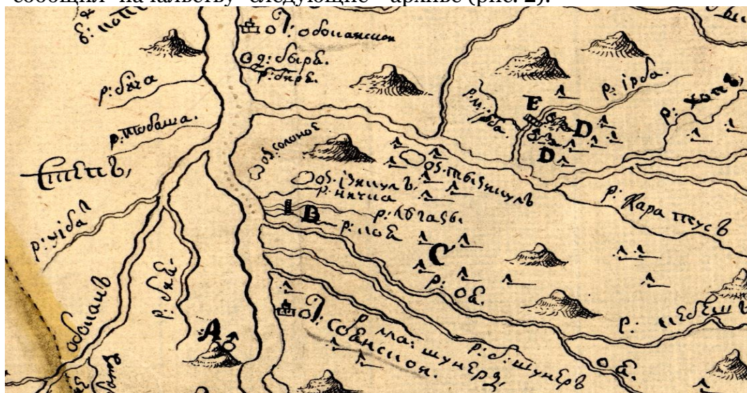
Рис. 2. «Ландкарта Томского и Красноярского уездам и рекам Енисею и Чульму и впадающим в них речкам рудным и удобным к строению заводов местам и около оных урочищ и жилью сколько оного где есть и о путях способно которым туда способно было припасы, а ежели тамо завод будет отуда медь ставить и об оном значат литера. В Красноярском уезде. А. Амаинской медной рудник. В. Назначенной медной завод. С. Удобные заводу к построению леса. D. Железные Ирбенские рудники. Е. Назначенной железной завод. F. О способном пути туда пристань ставить от деревни Легостаевой, которая на реке Чульме от реки Енисея в десяти верстах к селу Навозелову. Черчен 1734 году март месяц». Фрагмент [10]