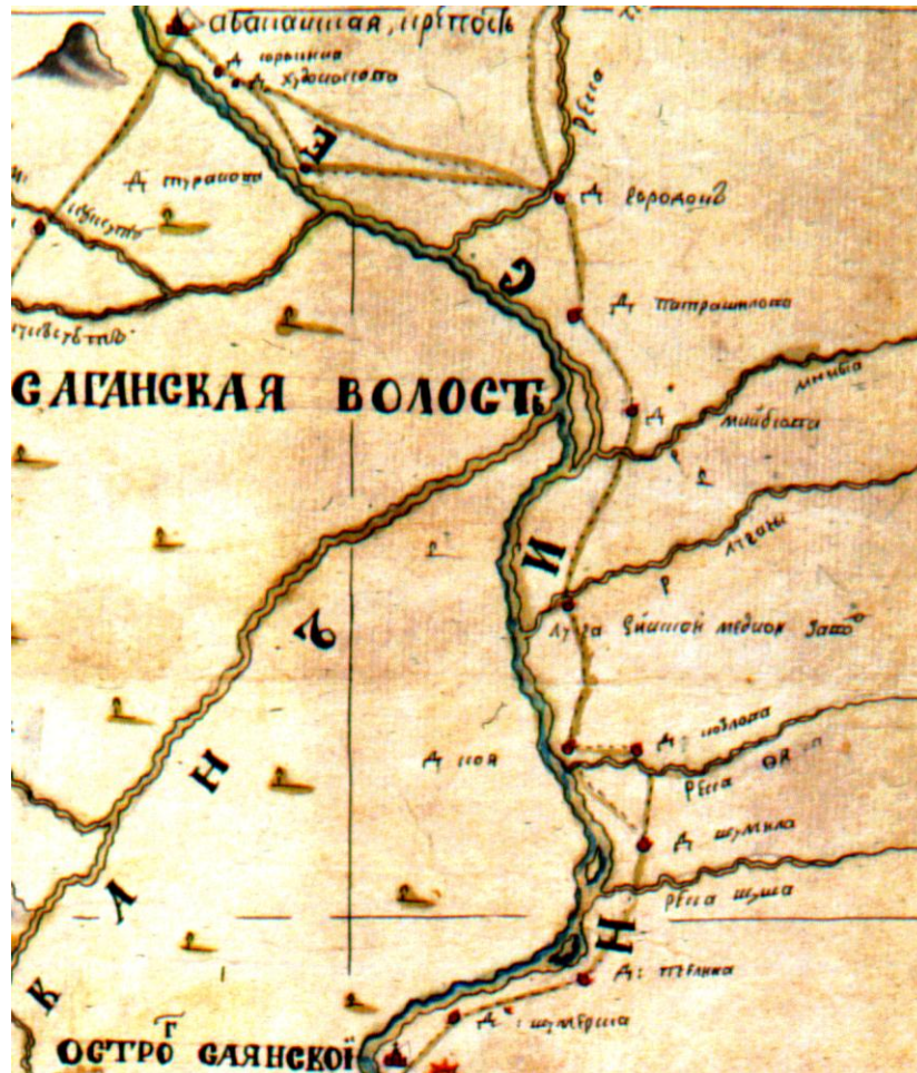
Рис. 4. «Карта с прожектом Сибирской губернии Красноярского и Кузнецкого уездов от Саянской крепости и реки Енисея чрез Телецкое озеро и Колывано воскресенские заводы до Усть Каменогорской и Семи палатинской крепостей границам Российской империи с китайским владением. 1746 г.». Фрагмент [13]

геодезистов, возглавлял которую инженер-капитан Сергей Плаутин. Под его руководством, по материалам экспедиции, была составлена в 1746 году «Карта с прожектом Сибирской губернии Красноярского и Кузнецкого уездов» (рис. 4).